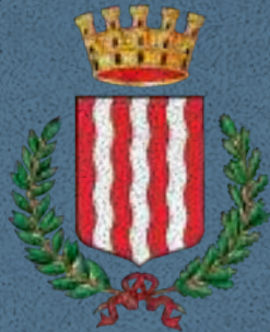
Città di Campodarsego