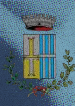
Comune di Villafranca Padovana