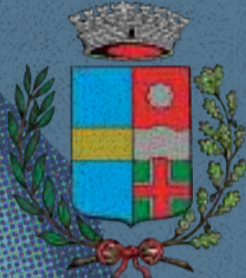
Comune di Massanzago