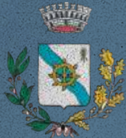
Comune di Campo San Martino