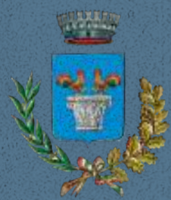
Comune di Galliera Veneta