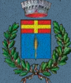
Comune di Curtarolo