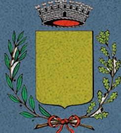
Comune di Campodoro