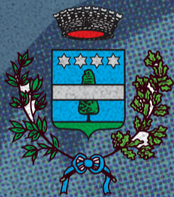
Comune di Gazzo Padovano