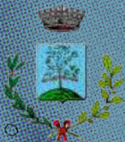
Comune di Tombolo