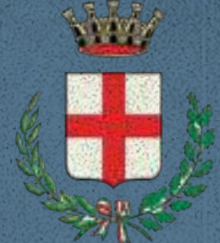
Città di Camposampiero