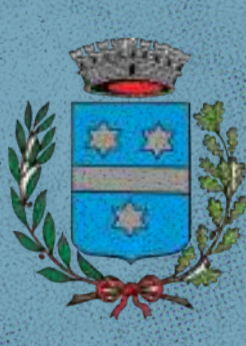
Comune di Villanova di Camposampiero

Iniziativa realizzata nell'ambito dei Piani di Intervento in materia di Politiche Giovanili "Reti Territoriali per i Giovani Veneti - RE.TE. GIO-VE (DGRV 1549/2021)" e "Giovani in Loco - GiL (DGRV 1550/2021)" - Progetto "GIOVANI PROTAGONISTI" - Ambito Sociale VEN_15