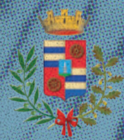
Città di Vigonza