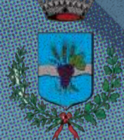
Comune di Loreggia