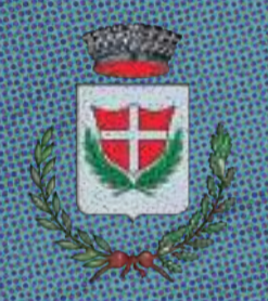
Comune di Grantorto