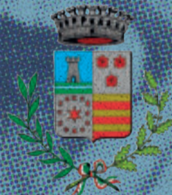
Comune di Vigodarzere