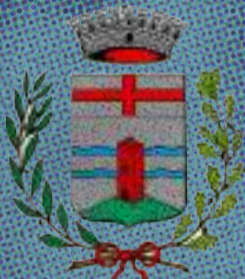
Comune di Santa Giustina in Colle