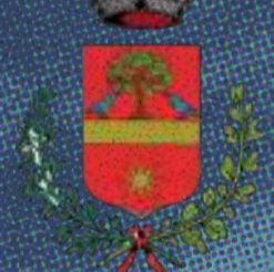
Comune di Piombino Dese