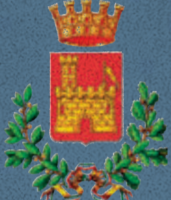
Città di Cittadella