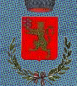
Comune di Limena