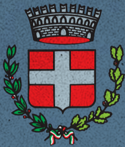
Comune di Carmignano di Brenta