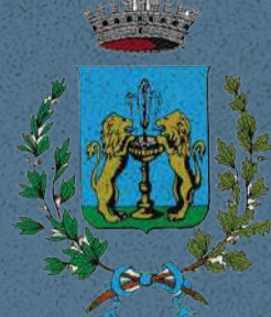
Comune di Fontaniva